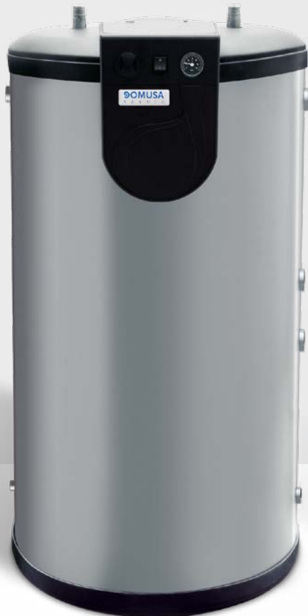
BT DUO 150-250

El ahorro energético es otro de los aspectos especialmente cuidados en este producto. Para reducir las pérdidas de calor del agua se aísla externamente el acumulador. El aislamiento térmico con el que se recubre el acumulador es de espuma de poliuretano de alta densidad y el proceso de aislamiento se realiza por un sistema de inyección que evita los puentes térmicos.