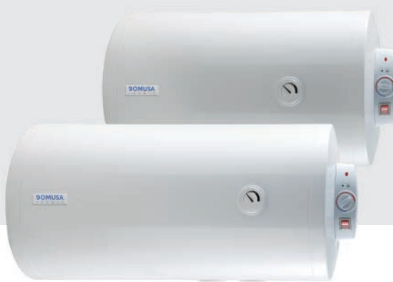
HYDRO H PLUS