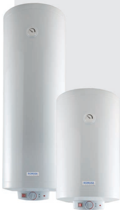
HYDRO V PLUS